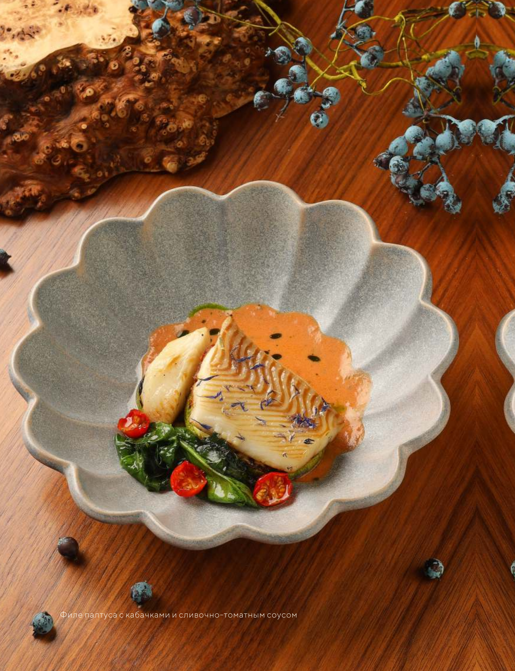
Филе палтуса с кабачками и сливочно-томатным соусом