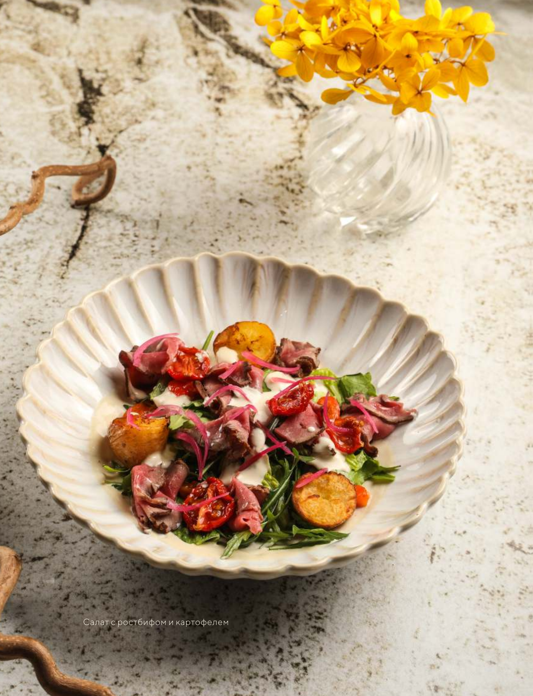
Салат с ростбифом и картофелем