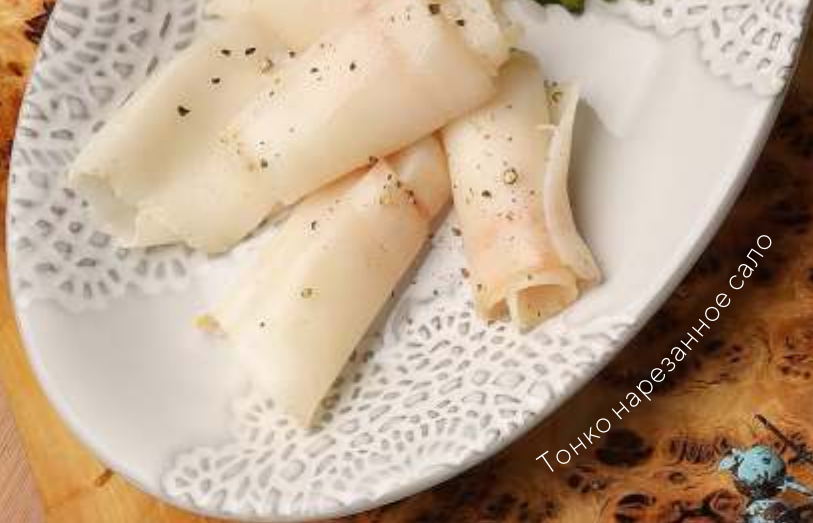
Тонко нарезанное сало